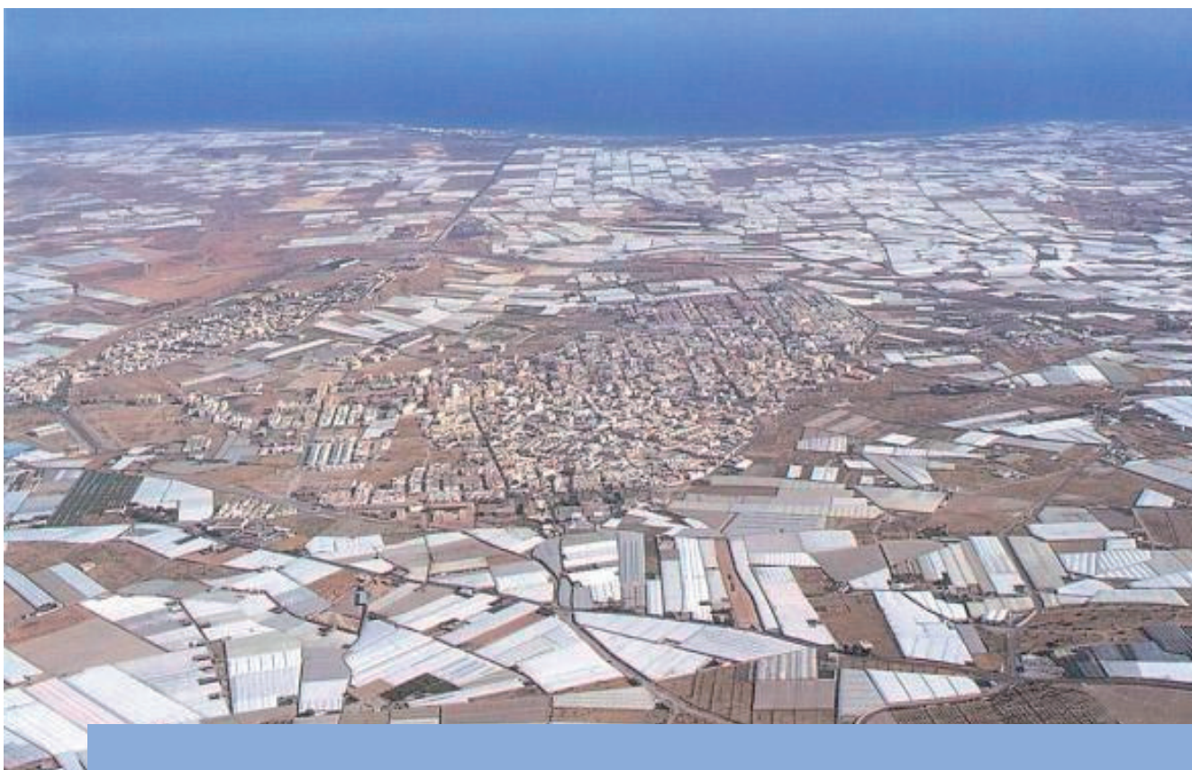
Fotografía de la zona donde podemos ver el pueblo de EL Ejido rodeado de invernaderos